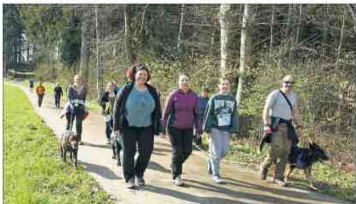
Environ 200 personnes ont participé à la première Run2Aid à Villars-Mendraz.